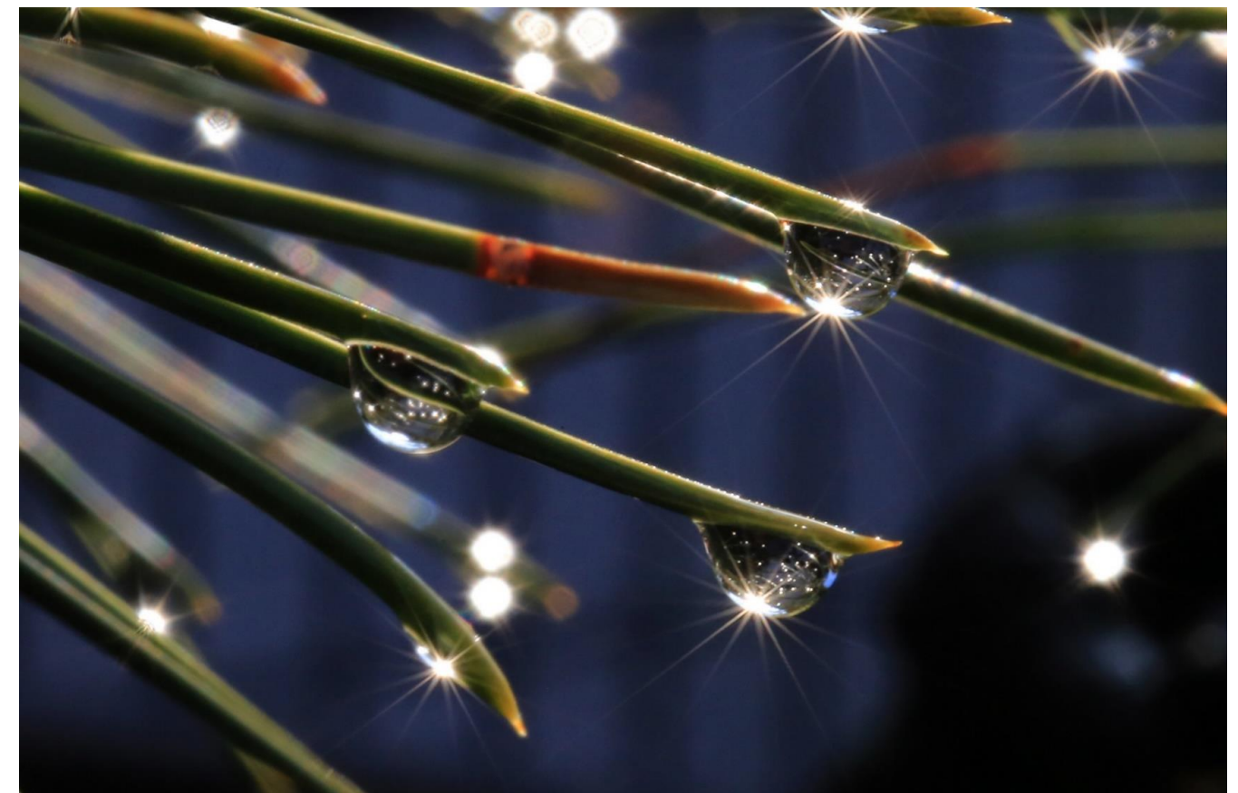
水玉の宝石 <我家の玄関>