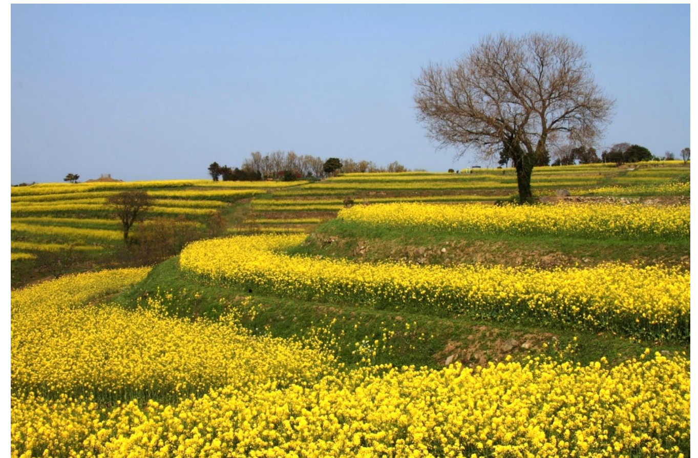
菜花の郷 <大分県国東> 一面に菜花が咲き誇り見事でした。