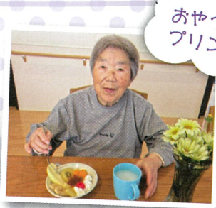
おやつしりて プリンアラモード